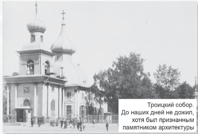
Троицкий собор. До наших дней не дожил, хотя был признан памятник архитектуры

Корпус Ф. М. Апраксина в 13 тысяч человек 15 марта 1710 двинулся по льду Финского залива с острова Котлин к Выборгу. По словам датского посланника Юста Юля, русские войска выступили в поход в «самый ужасный мороз», в который другая европейская армия бы просто погибла. Но «русские так выносливы, что с ними можно совершить то, что