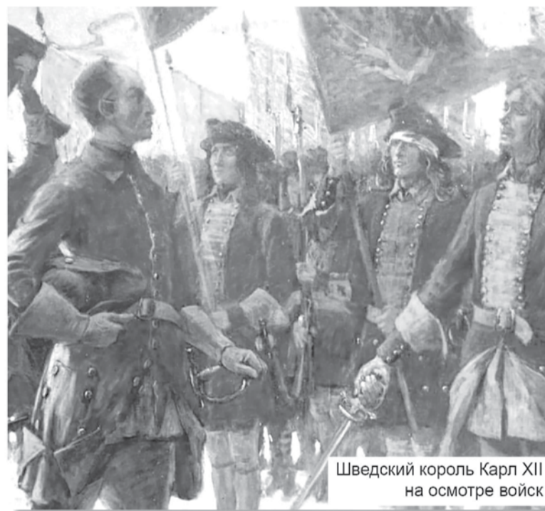
Шведский король Карл XII на осмотре войск