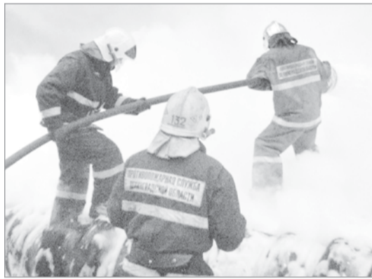
На соревнованиях пожарных