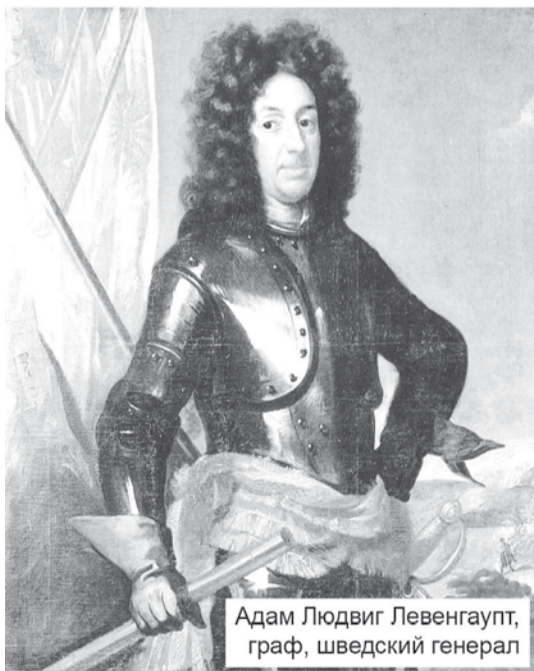
Адам Людвиг Левенгаупт, граф, шведский генерал

Зимой 1708-1709 годов шведская армия расположилась в районе Прилуки – Гадяч – Ромны – Лохвица. Попытки шведов расширить этот район в ноябре 1708 года окончились неудачей из-за сопротивления местного