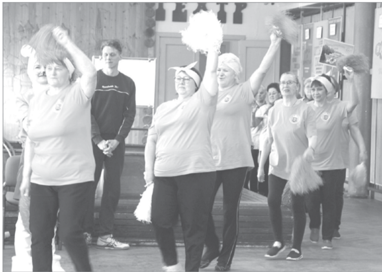
«Визитка» от «Бабушек-заюшек»