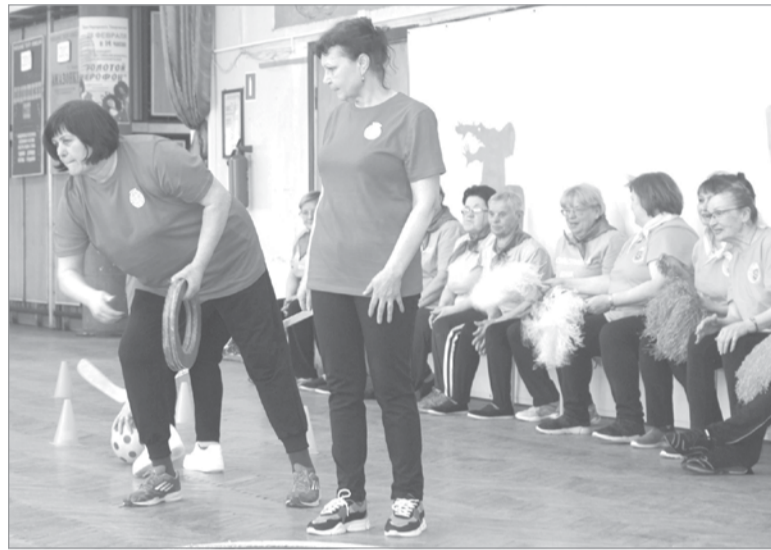
Кто самый ловкий?

По итогам всех конкурсов были определены победители. Первое место заняла команда «Оптимисты», второе – «Бабушки-заюшки» и третье – поделили команды «Не скучай» и «Свирьстройская волна». Все участники праздника получили фотографии на память и сладкие призы, а затем пообщались за чашкой чая.