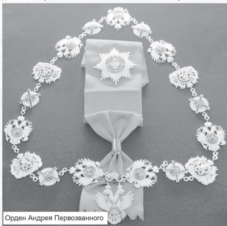
Орден Андрея Первозванного

дипломатической активности западных держав. Великобритания предприняла попытки расколоть Северный союз и весной 1710 года подписала в Гааге с Австрией и Голландией конвенцию о сохранении «нейтралитета» и соглашение о недопущении военных действий на территории Германии. Карлу удалось с помощью английской и австрийской дипломатии втянуть в Северную войну Османскую Порту, которая в 1710 году объявила войну России.