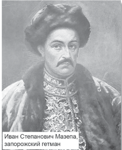
Иван Степанович Мазепа, запорожский гетман

С весны 1708 года в районе Выборга сосредоточивались шведские войска под командованием генерал-майора Любекера. Перед ним ставилась задача разгромить русских в Санкт-Петербурге, захватить город, разрушить крепость и сжечь верфи. Для содействия сухопутным войскам в мае 1708 года к Берёзовым островам пришла шведская эскадра адмирала Анкерштерна. 1 августа 1708 года двенадцатитысячный корпус Любекера выступил из Выборга. Но из-за проливных дождей темп движения был нарушен с самого